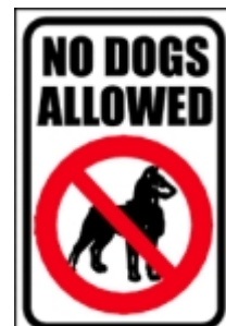
Maar waarom dan ook nog zo?