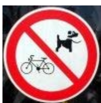
Afbeelding 11 Verboden, maar waarvoor of voor wat?

Verboden voor fietsen en aangelijnde honden?