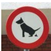
Een duidelijk verbodsbord