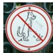
Hier mag blijkbaar niet alleen niet gepoept maar ook niet geplast worden