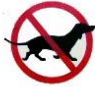
Diagonale streep, linksboven naar rechtsonder