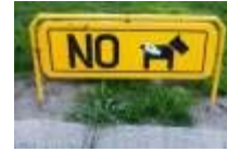
Eenvoudig maar toch wel duidelijk