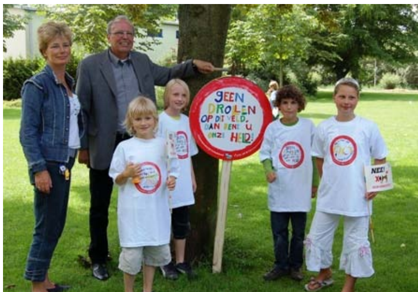
Afbeelding 2 Illustratie van een probleem

Voor deze kinderen van de Jenaplanschool Wijdschild in Gorinchem is het duidelijk wat het probleem is: hondenpoep.