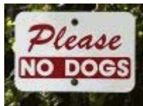
Een vriendelijk verzoek