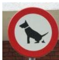
Anatomisch niet waarschijnlijk