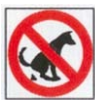
Onnodige verwarring door de toevoeging van een overbodige diagonale streep