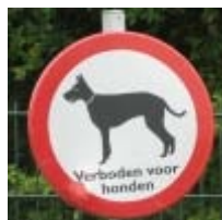
Een eenvoudige variant