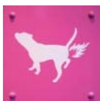
Afbeelding 11 Het kan altijd nog gekker