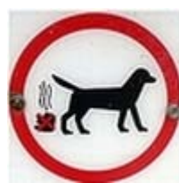
Een afbeelding met een extra dimensie: een dampende hoop