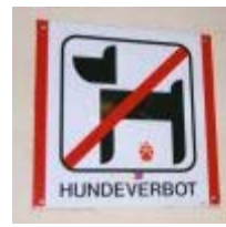
En in het Duits, ook al met overbodige streep