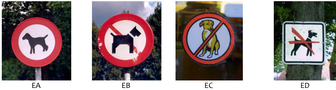
Afbeelding 4 Categorieën hondenverbodsborden

De verzameling is grotendeels gebaseerd op zoekwerk op internet met zoektermen als ‘verboden (voor) honden’, ‘Hundeverbod’, ‘No dogs (allowed)’, ‘Chiens interdit’, ‘No perros’ en daaraan verwante en vergelijkbare zoektermen. Een aantal particulieren stuurde via de e-mail afbeeldingen van borden op. De verzameling omvat op dit moment 392 borden.