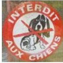
En in het Frans, met overbodig kruis