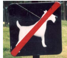
Naar rechts, maar doorsneden