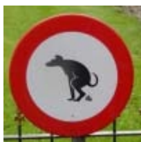
Maar wat voor hond is dit eigenlijk?