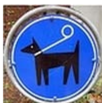
Afbeelding 10 Honden alleen aangelijnd

Een gebodsbord: hier alleen aangelijnde honden.