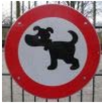
Geen diagonale strepen