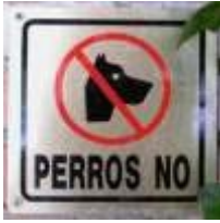
En in het Spaans, met overbodige streep